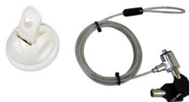
タブレット☆吸着ロック AC-TB1

去ることはできなくなります。解錠後はレバーを上げる(吸着オフ)と、本体は簡単に機器から外れます。真空パワーにより100N/10Kgsの吸着力を持つ吸盤には、機器の設置部分を傷めない高品質ラバーを採用。