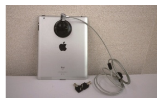
iPad に装着 (ブラック)

本製品では、セキュリティロックがレバーごと施錠する仕組みであるため、解錠するまで本体の吸着は解除できません。よって、セキュリティワイヤーをデスクなどに巻き付けておけば機器を持ち