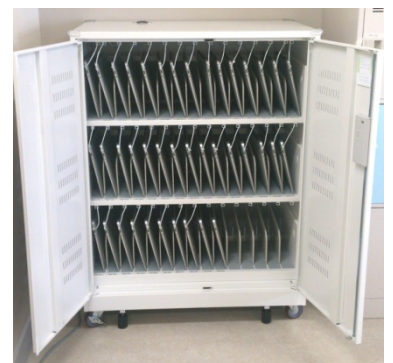
45 台のタブレットを収納し、タイマー制御で充電できる「タブレット保管庫☆おまかせ充電」TPR-AC45LS

教育現場でのタブレット端末の利用が、いよいよ本格化の時期を迎えようとしています。CAI 教室のデスクトップパソコンをタブレット端末に置き換え、また児童生徒の全員にタブレット端末を配布するなどの動きが全国の自治体・学校の単位で始まっています。導入を進めるにあたっては、校舎内で多数のタブレット端末をセキュアな状態で保管し、安全で適切な充電を施し、いかに管理していくかということが大きな課題の一つとして挙げられます。この課題をクリアする製品としてアクティブが開発したのが「タブレット保管庫☆おまかせ充電」です。