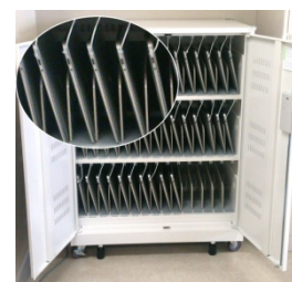
内部収納イメージ