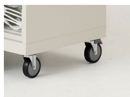
移動用キャスター