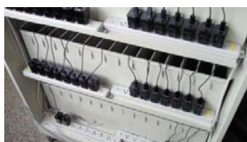
バックパネル内イメージ