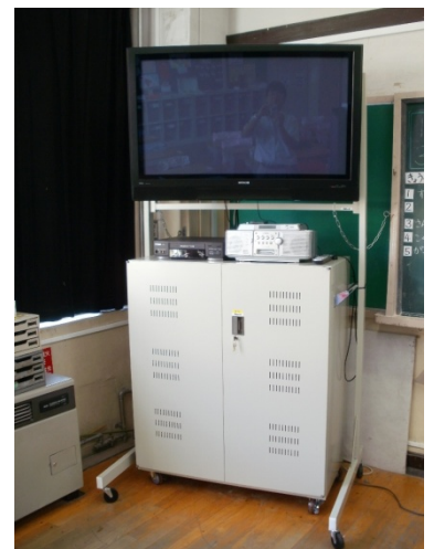
現場の要望に応え、本製品と組み合わせた TV スタンドを提案、製作した例（平置きタイプ）

製品はクラス人数に応じて、30 台収納の TPR-AC30LS（本体価格：208,000 円）と 45 台収納の TPR-AC45LS（本体価格：258,000 円）（各税別）の 2 機種。導入先の状況と要望にあわせた各種カスタマイズに柔軟に対応し、利用環境に最適かつ管理者（先生方）の負担を最小にする仕様で納品、現地での設置セットアップまで責任をもって対応します。