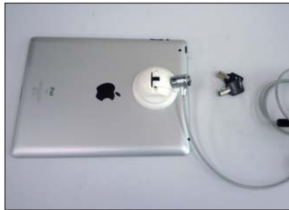
■セキュリティスロット部にシリンダ錠を取り付ける