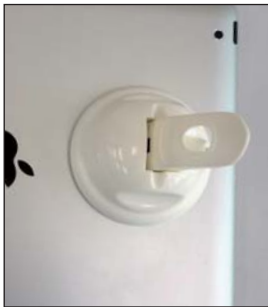
■iPad背面に吸盤部を設置