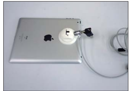
■鍵を差し込んで施錠・開錠を行う