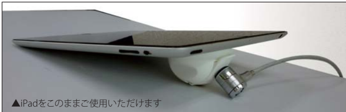
▲iPadをこのままご使用いただけます