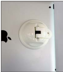
■レバーを下げてしっかり固定